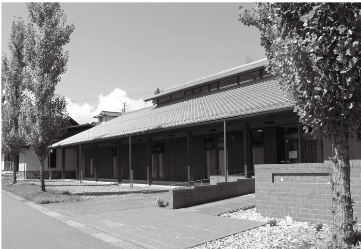
満蒙開拓平和記念館外観

もともと海外移民に積極的であった長野県は、国に先んじて集団移民を画策。一九三七年には