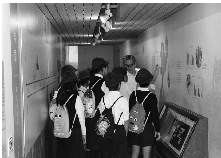
ボランティアの説明を聞く生徒たち