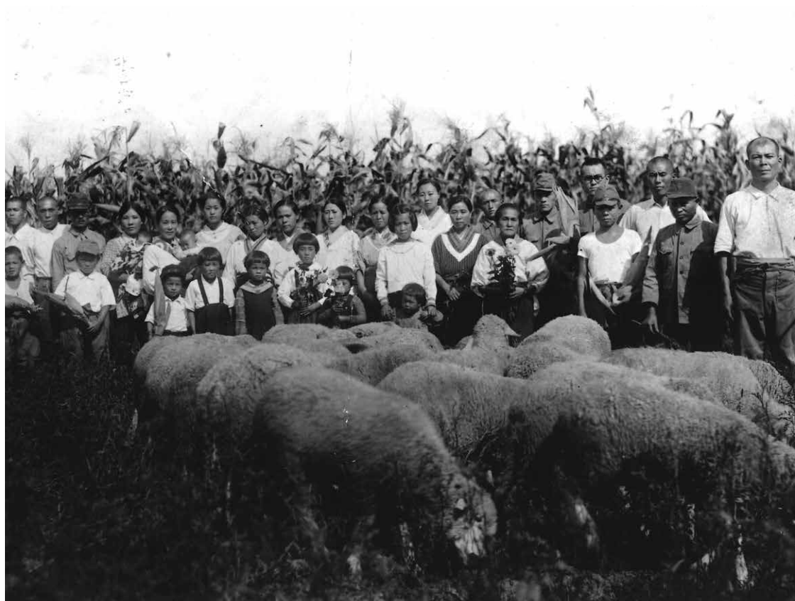
長野県下伊那郡から送出された水曲柳開拓団（1943年頃）