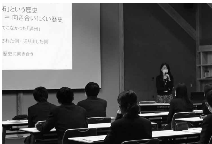
セミナールームでの学習講話

最後に、子どもたちの代表があいさつを述べた。曰く、「加害者であることから逃げないでこの歴史に向き合っていきたいです」。心震える瞬間だった。