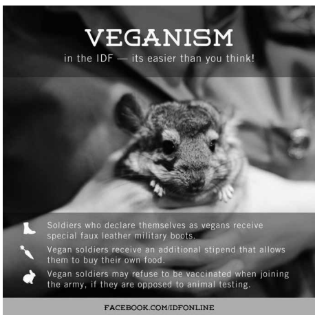
イスラエル国防軍のヴィーガニズムに関する投稿で用いられている画像 ※6

軍によるヴィーガンウォッシングだ。これはヴィーガンという言葉と、「ごまかす、うわべを取り繕う」という意味のホワイトウォッシングという言葉をかけ合わせた造語である。この言葉は、イスラエル政府がパレスチナの長引く占領やパレスチナ人への人権侵害といった負のイメージを、動物の権利に関する先進的なイメージによって覆い隠していることを批判するため用いられる。このヴィーガンウォッシングの事例は枚挙にいとまがない。イスラエル国防軍は国際ヴィーガンデーに合わせてイスラエル国防軍がヴィーガン・フレンドリーであり、仮に徴兵された兵士がヴィーガンであっても無理なく軍務につけることをアピールする ※5 。ほかにも